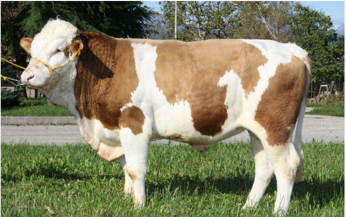
Foto: toro RUPENO venduto in Romania

zo nei quantitativi previsti dallo schema di selezione della Pezzata Rossa Italiana. Si rammenta inoltre che in questa operazione oltre ai tori sono state vendute delle dosi di seme, contiamo sia l'inizio di una positiva collaborazione con la Pezzata Rossa Rumena.